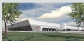
Châtres - 77