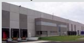
Marly la ville - 95