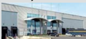
Marly la ville - 95